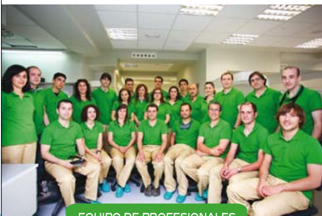
EQUIPO DE PROFESIONALES