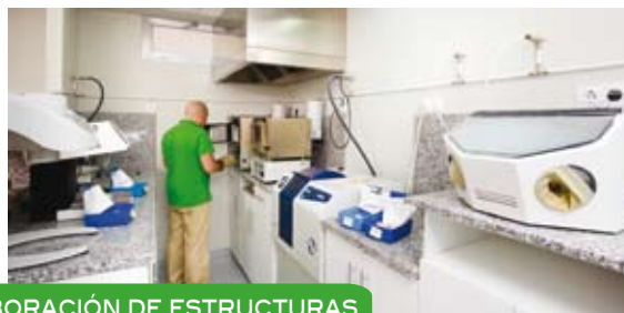
ELABORACIÓN DE ESTRUCTURAS