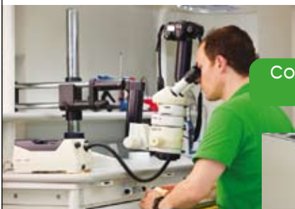
CONTROL DE PASIVIDAD Y AJUSTES