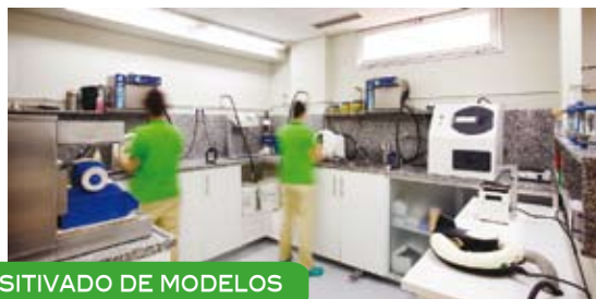
POSITIVADO DE MODELOS