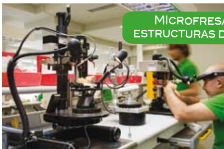
MICROFRESADO PARA ESTRUCTURAS DE IMPLANTES