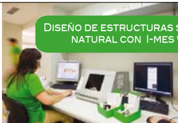
DISEÑO DE ESTRUCTURAS SOBRE DIENTE NATURAL CON I-MES WIELAND